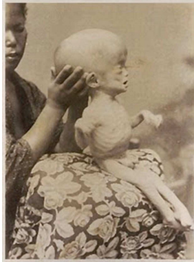
Ziehier een extreem voorbeeld van een kind met een waterhoofd.

Hoewel men in zo'n geval imbeciel is, dus zeker niet intelligent, waren er onder deze 600 een dertigtal met een IQ van 100 of zelfs meer! Lorber vertelt over een student wiskunde met een globaal IQ van 128 en een verbaal IQ van zelfs 143. Toch was de schedel van deze student voor 95% gevuld met vocht! Wat er van het brein over was, lag als een laagje van 1 à 2 mm dik geplakt tegen de binnenkant van de schedel. Met andere woorden: de man had bijna geen brein! Men stelde een hersenhoeveelheid vast van 100-150 gram, terwijl 1500 gram normaal is. Uiteraard gaat dit in tegen alles wat de neurowetenschappen ons vertellen. Dit kàn immers niet!